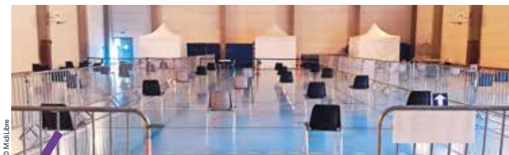
Trois cabinets de consultation dans des tentes et une salle d'attente aux sièges espacés ont été aménagés dans le gymnase.

Saint Georges d'Orques Solidarité à la chaîne