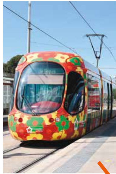
En service et gratuits, les bus et tramway sont désinfectés au quotidien.

Les transports publics sur l'ensemble du réseau TaM sont entièrement gratuits pour tous les actifs mobilisés au quotidien durant cette crise. Sont également concernées toutes les personnes ayant des démarches médicales ou familiales impérieuses. Les horaires et les dessertes des lignes de tramway et de bus s'adaptent également aux contraintes du personnel soignant (voir p.16-17). Lorsqu'il emprunte les transports en commun, chaque usager doit impérativement être muni d'une attestation de déplacement. À noter que la sécurité sanitaire a été renforcée : l'intérieur et l'extérieur des bus et des tramways sont désinfectés quotidiennement.