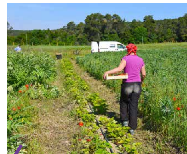
Les drives fermiers autorisés et mis en place offrent aux producteurs locaux des débouchés supplémentaires pour écouler leurs productions durant cette crise sanitaire.

Depuis le 9 avril, en complément du site internet, un numéro vert spécial BoCal permet aux consommateurs d'identifier le point de vente ou les réseaux de livraison les plus proches de chez eux. Il s'agit du n° vert 0800 730 983 (ouvert de 8h30 à 17h, du lundi au vendredi).