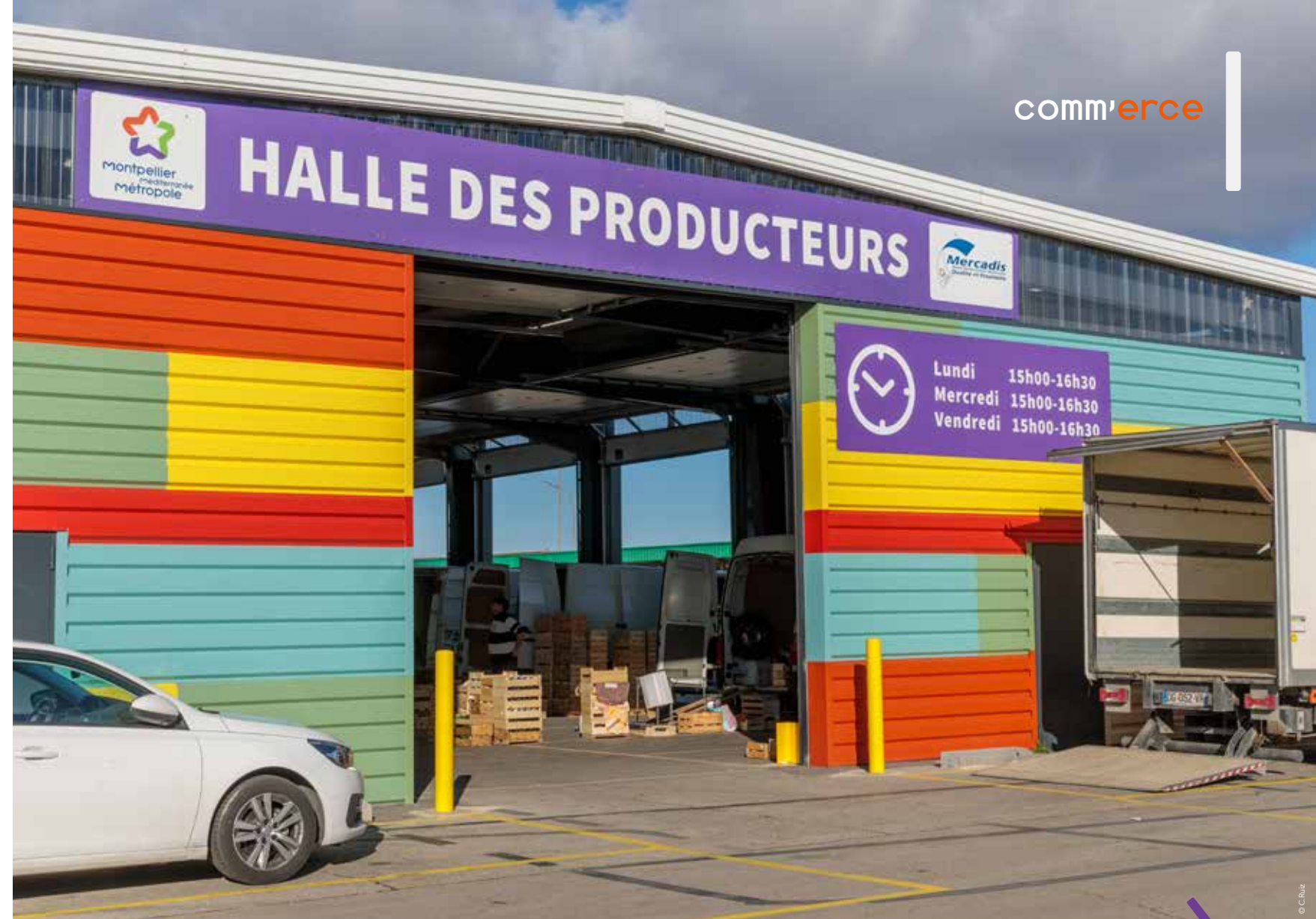
Les commerçants s'approvisionnent auprès des producteurs locaux au sein de la halle des producteurs au Marché d'Intérêt National (MIN) de Montpellier.