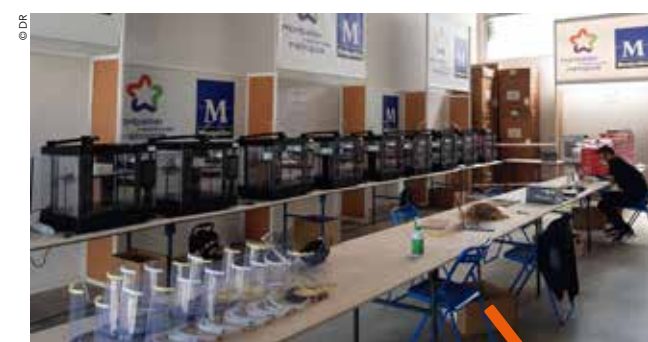
Les dix imprimantes 3D produisent 300 visières de protection par jour.

cadre de la crise sanitaire actuelle », rappelle Philippe Saurel, qui s'est rendu sur place le 9 avril pour soutenir les équipes qui travaillent d'arrache-pied. Les actions de cette cellule de coordination portent également sur le recensement des besoins internes à la Ville et à la Métropole de Montpellier, ainsi que ceux des structures satellites et des entités externes. Elle travaille aussi à l'identification des acteurs de la production d'équipements de protection, afin d'évaluer et d'optimiser le potentiel de production sur l'ensemble du territoire.