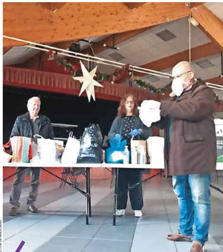
Depuis le 23 mars, une permanence a lieu tous les jours de 10h30 à 12h salle Les Arbousiers à Restinclières.

Restinclières | Beaulieu | Saint Genies Des Mourgues Les professionnels de santé vous remercient