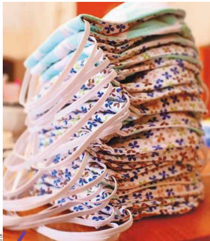
Des masques confectionnés par Carole, une des « couturières » de Cournonsec.

Baillargues | Saint-Brès Un centre COVID-19