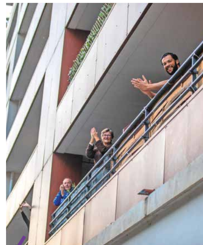
Les applaudissements quotidiens renforcent les liens entre voisins.