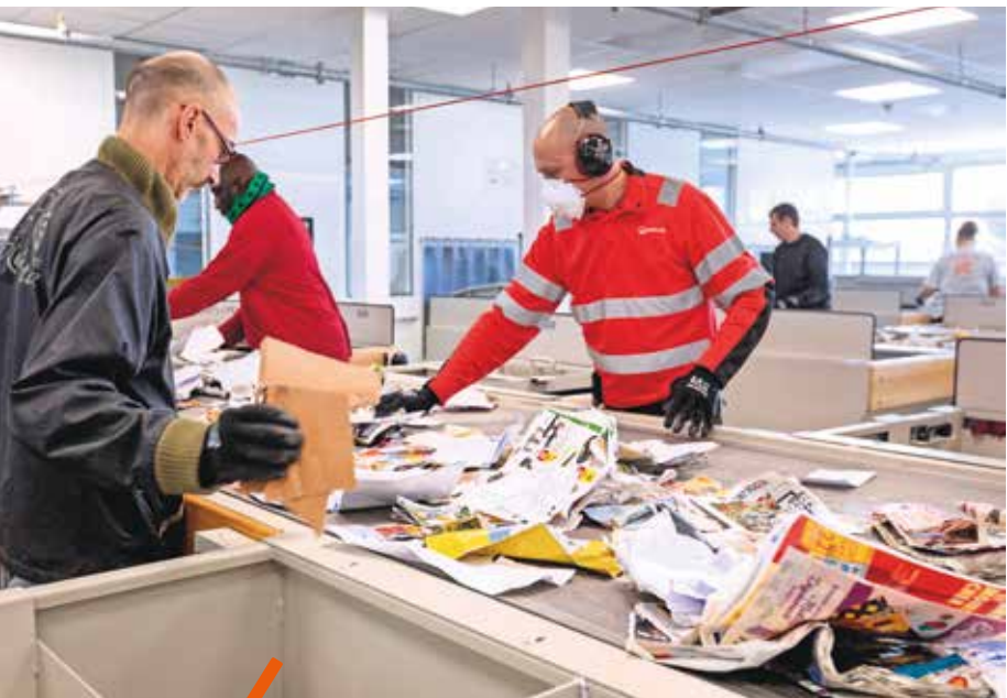
Le tri de déchets de la Métropole continue à Demeter.