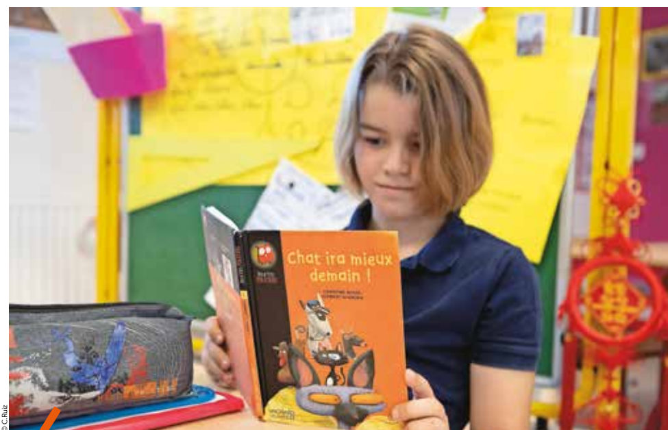
Inscription offerte pendant un mois pour tous les habitants de la Métropole.